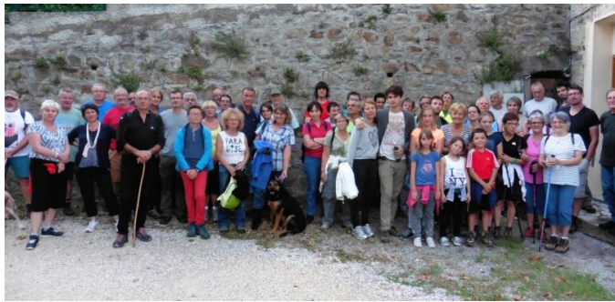
Figure 5 : Participants à la randonnée nocturne

A Robiac-Rochessadoules, le 1er août, le GDF était partenaire d'une randonnée nocturne (20h30 à 23h30), guidée par le président et le technicien du Syndicat,