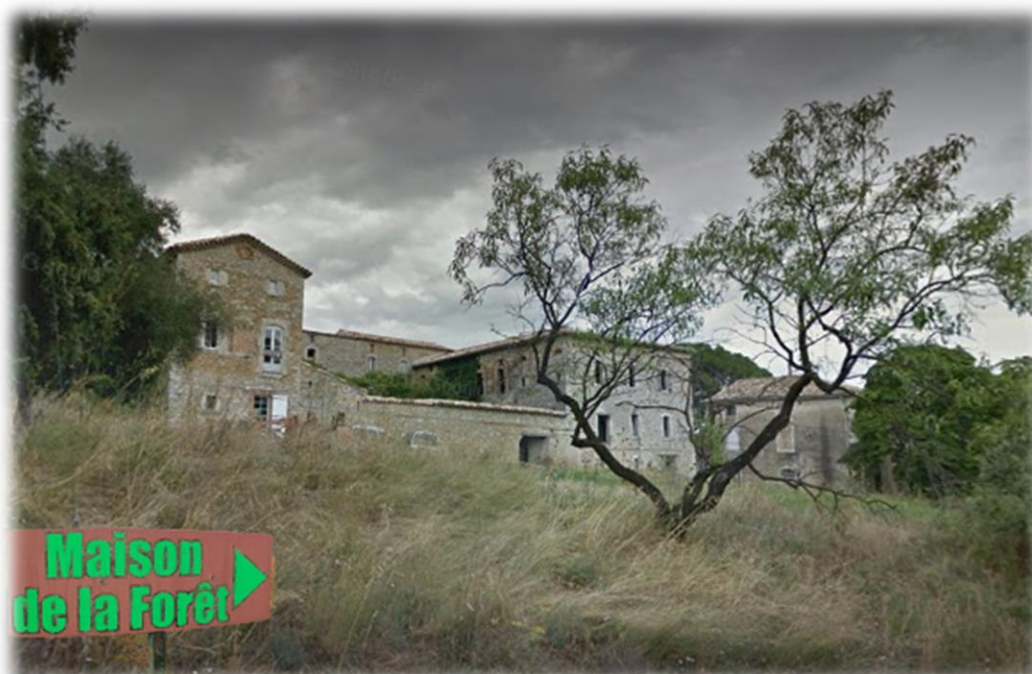
Mas de Monac abritant La Maison de la Forêt

Convention entre le Conseil départemental du Gard et le Syndicat des Forestiers Privés du Gard