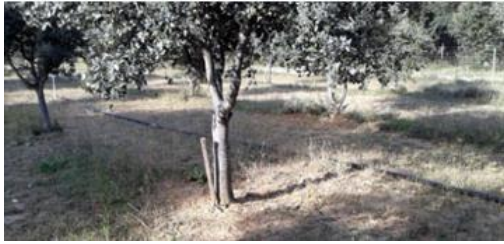
Figure 9 : Exemple de truffières dans le département du Gard

Lors de ses visites, le technicien du Syndicat peut avoir à prodiguer des conseils concernant la sylviculture truffière.