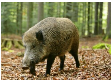
Figure 7 : Sanglier dans le Gard

Le département est divisé en 30 Unités de gestion des sangliers regroupés en 14 secteurs de réunion. Un des administrateurs du Syndicat est délégué aux réunions des secteurs où les enjeux forestiers sont importants.