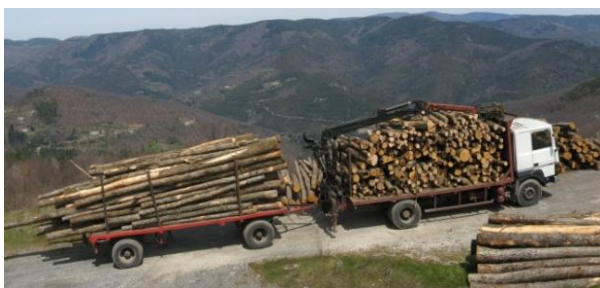
Figure 8 : Camion chargé de bois de châtaignier

Le Syndicat contribue à la mobilisation des bois en prenant une part active dans le PDMF des Cévennes orientales. L'un des objectifs de ce plan est de faire sortir davantage de bois des forêts privées, notamment pour alimenter les unités de transformation locales.