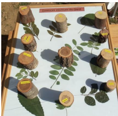
Figure 3 : Jeu ludique de reconnaissance des essences feuillues du Gard

Une collection d'échantillon de bois du département a été constituée depuis une dizaine d'années par le GDF. Celle-ci constitue une Xylothèque avec 71 échantillons de bois d'essences différentes exposés à la Maison de la Forêt de Bagard. Un support mobile constitué de 30 échantillons sert également de démonstration dans des salons ou des journées d'information sous forme de jeu de reconnaissance des arbres feuillus du Gard. Des flyers plastifiés sont fournis en complément pour présenter les feuilles séchées et la description des usages et propriétés de certaines essences.