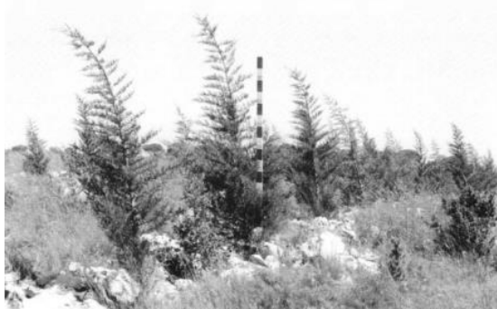
Figure 2 : Cyprès méditerranéens du Sylvetum du Clos Gaillard

En 1990, une convention mise en place entre la ville de Nîmes, l'ONF et le GDF a mandaté ce dernier pour deux projets expérimentaux ambitieux de reboisement après incendie. Des parcelles de la forêt communale du Clos Gaillard à Nîmes ont donc été choisies pour accueillir le Sylvetum et le Vallon des chênes sur 5 ha. Le suivi technique et scientifique de ces deux sites est assuré par le GDF.