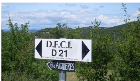
Figure 6 : Panneau de desserte de la DFCI dans le Gard

Le Syndicat a participé le 8 mars 2016 à la sous-commission départementale Feux de Forêt. Il y a été rappelé que les 30 000 km de pistes créées sur le département sont aujourd'hui très difficiles à entretenir.